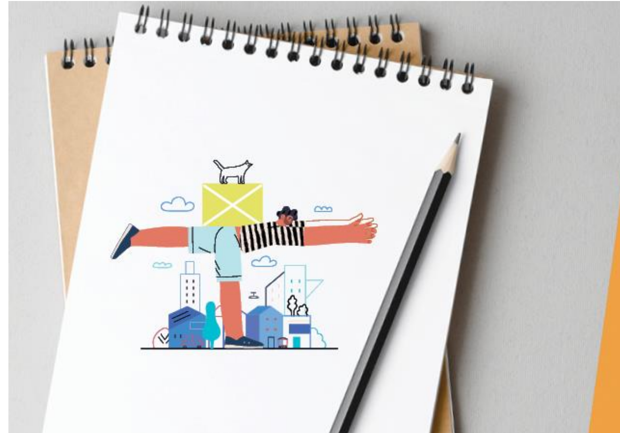
Grafik: Servicezentrum Inklusion