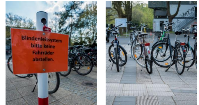
Bild: Inklusiver PeerSupport der PhilFak